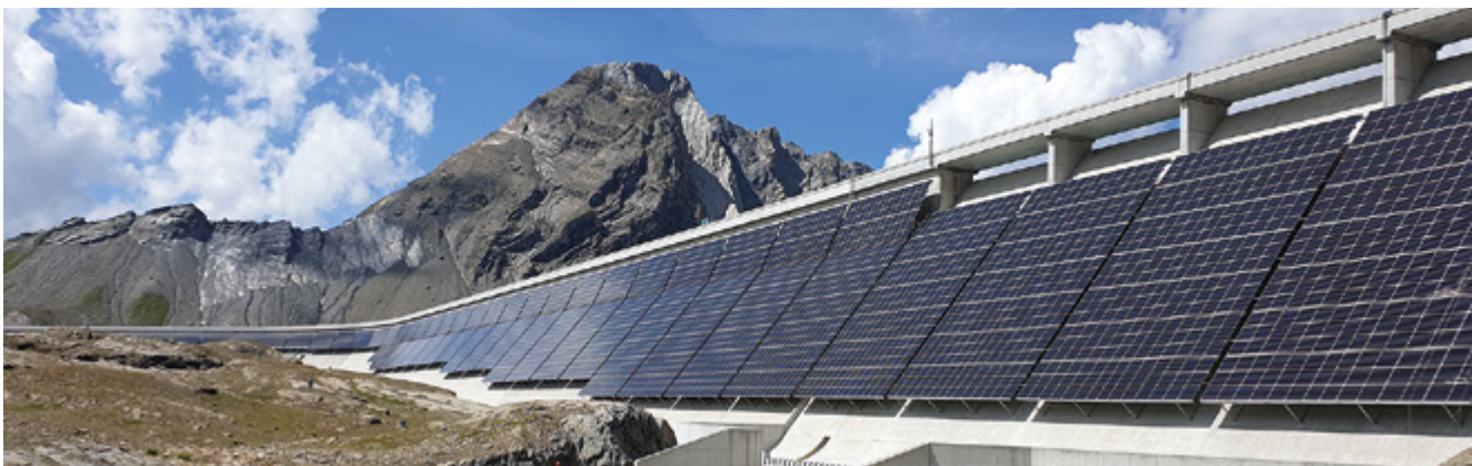
Abbildung 1: Das Beispiel der grössten alpinen PV-Anlage in der Schweiz, welche die Axpo zusammen mit IWB an der Muttsee-Staumauer auf 2500 Meter über Meer realisiert hat. Sie ist seit Ende August 2022 vollständig in Betrieb und produziert pro Jahr 3,3 GWh Strom – die Hälfte davon im Winter

Zweitens sollten vermehrt PV-Anlagen an Fassaden gebaut werden. Die Gestaltungsmöglichkeiten sind vielfältig. Zahlreiche Beispiele belegen, dass auch Fassadenanlagen wirtschaftlich sein können. Einen Beitrag dazu leistet der Neigungswinkelbonus für stark geneigte PV-Anlagen bei der Einmal-