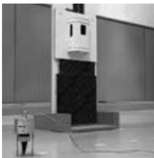
Abbildung 1: Versuchsaufbau an der Empa Dübendorf zur Ermittlung der Erker-Wirkung.

Um auch an dieser lärmbelasteten Strasse (65 dB) einen hohen Wohnkomfort sicherzustellen, sind spezielle Massnahmen notwendig. Deshalb wurden eigens Schalldämm-